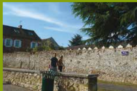
De haut en Bas : Halle du marché Place de la liberté Rue du petit moulin