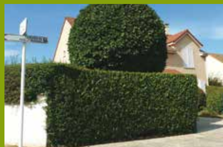
De haut en Bas : Rue Paul Cézanne Rue Claude Monet