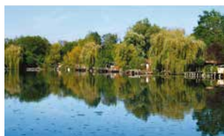
De haut en Bas : Le Château du Saussay Les roches du Père la musique Le parc Christian Imbert La chapelle Saint Blaise Les étangs de Boigny