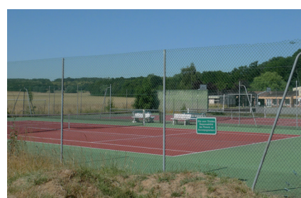
Des activités sportive à proximité

15 rue Charles Ferdinand Dreyfus BEL AIR Fontenay les Briis Contact : 06 62 51 64 58