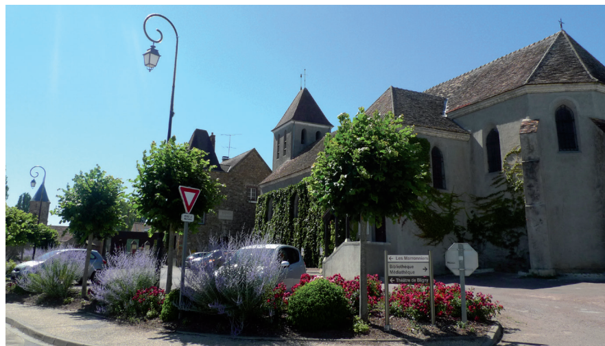
Place de l'église