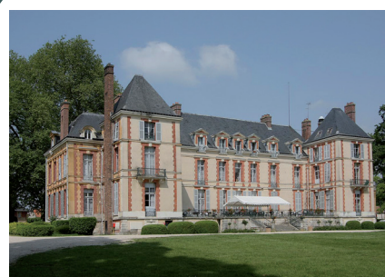
Château de Fontenay-les-Briis