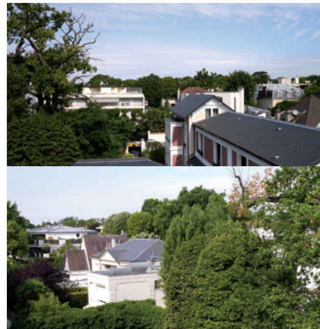
Vues depuis la résidence : belles demeures et bois de vincennes